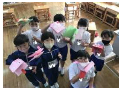
【工作「パクパクさん」と(1年)】

本校の校庭が秋色に染まり、徐々に落ち葉のにぎわいとなってきました。学校周辺の景色も含め自然豊かなすばらしい環境の下、教室の学びだけではうずうずしてしまいそうです。今月も地域の方々の御協力・御厚意を受けながら様々な活動を行うことができ、感謝申し上げます。子どもたちは、今週末の「池小まつり」や翌月の「持久走大会」などに向けて、アクティブに取り組んでおりました。