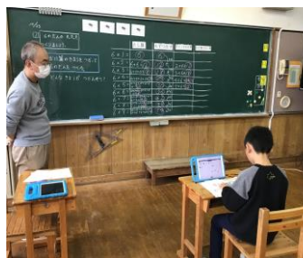
職員研修のようす よりよい授業を目指して

既習の九九づくりからかけ算の性質を使って、6のだんの構成を考えます。2年生は1名の児童です。ICTを上手に使い、課題に向かって、一生懸命に6のだんの九九を導き出していました。