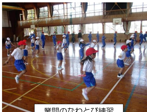
業間のなわとび練習

児童全員が、希望をもって4月からの新年度を迎えられるように石川小学校教職員全員が全力を尽くしてまいります。引き続き、子どもにとって大切な「教育環境」となる「学校・保護者・地域の協働実現」に向けたご協力・ご支援をお願いいたします。