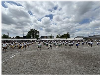
１・２年生「ブラザービート」

あいさつでもお話ししましたが、子どもたちはこの約一か月、運動会に向けた活動を通じて他では得られない貴重な経験を大きく成長してきました。その成長を感じていただけていれば幸いです。今後ともご支援ご協力をよろしくお願いいたします。