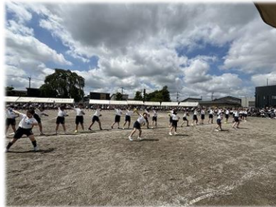
３・４年生「ライラック」