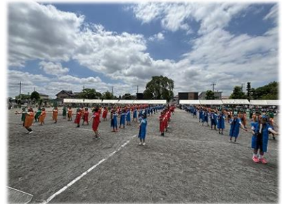
５・６年生「楽しいソーラン節」