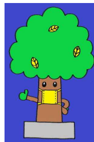
けやきくん マスク・バージョン

この10月は、裏面のような校外での体験的な学校行事等があったり、29日(木)に迫った運動会が行われます。新型コロナウイルス感染症の予防の観点から、様々な制約があり内容の変更も多々ありますが、子どもの学びの充実に、今後とも努力をします。地域及び保護者の皆様のますますのご理解とご支援をよろしくお願いいたします。