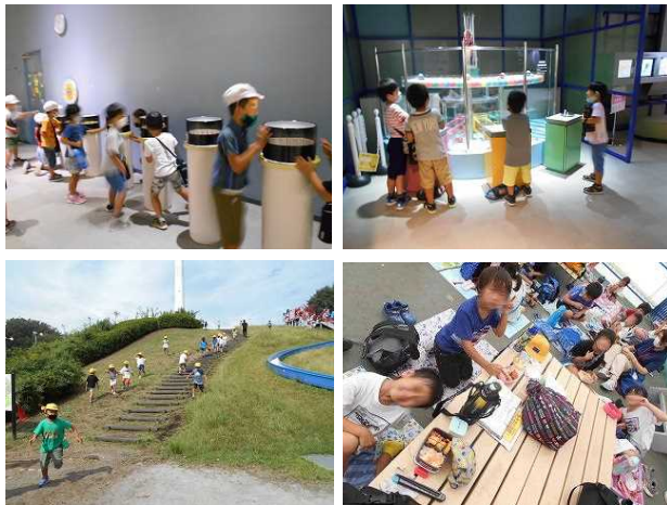
【1年生遠足(栃木県こども総合科学館)】