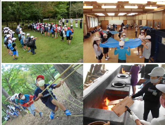
【4年生自然体験学習(自然体験交流センター)】