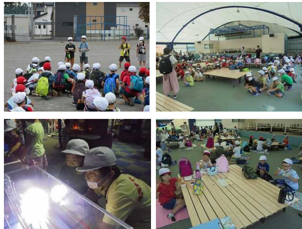
【2年生遠足(栃木県こども総合科学館)】