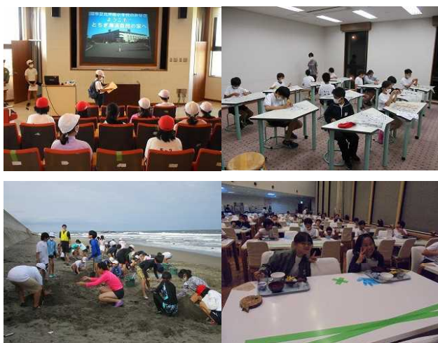
【5年生臨海自然教室(とちぎ海浜自然の家他)】