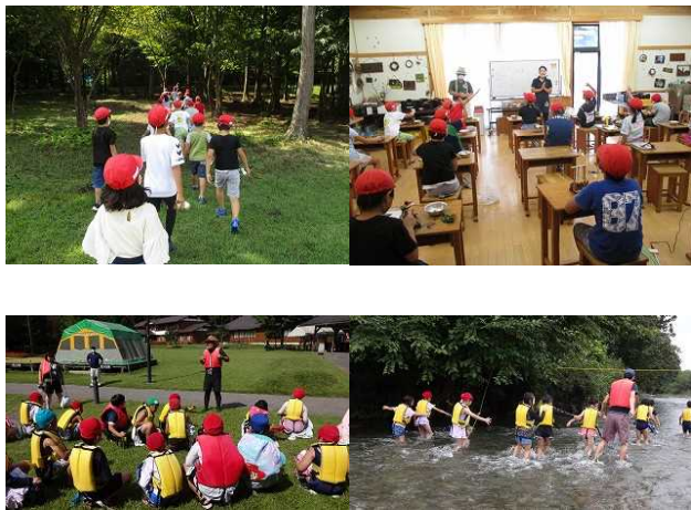
【3年生遠足(自然体験交流センター)】