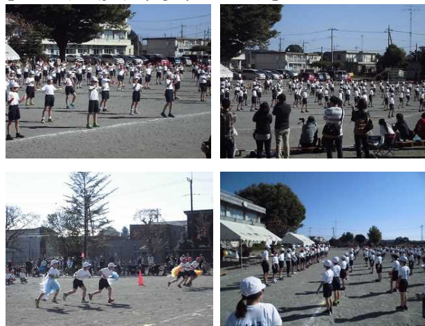
【10/29 運動会:中学年のようす】