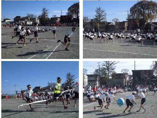
【10/29 運動会:高学年のようす】