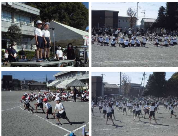
【10/29 運動会:低学年のようす】