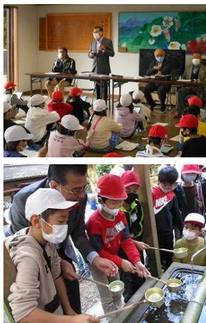
生子神社氏子の皆様