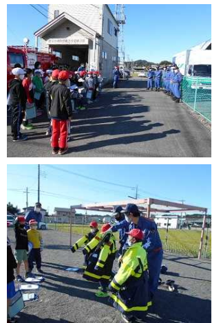
消防団第三分団第三部の皆様