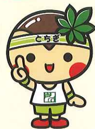
とちまるくん©栃木県